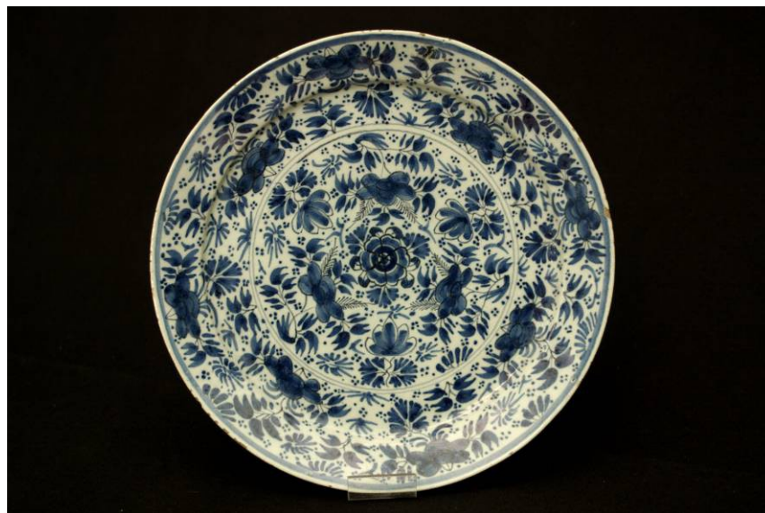
Assiette à motifs de fleurs et de végétaux stylisés, 18 ème siècle, Faïence émaillée, Manufacture de Delft (provenance présumée), Coll. C.H.L.

Ces assiettes au décor de chinoiseries bleues sont caractéristiques de l'influence de l'Extrême-Orient sur la céramique européenne. A partir du 17 ème siècle, elles se répandent en Europe, grâce à la manufacture de Delft en Hollande dont les modèles sont copiés ensuite par les manufactures françaises. Les décors de motifs stylisés de pagodes et de personnages illustrent un imaginaire collectif empreint d'exotisme, en vogue jusqu'à la fin du 19 ème siècle.