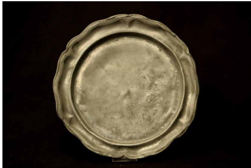
Assiette, 18 ème siècle, Etain, Coll. C.H.L.

L'écuelle, en usage dès le Moyen Âge, a la même fonction que l'assiette creuse actuelle. En bois, en terre cuite ou en métal, elle sert à la consommation des bouillons et des potages. A la fin du 18 ème siècle, elle est progressivement remplacée par l'assiette à soupe ou par le bol.