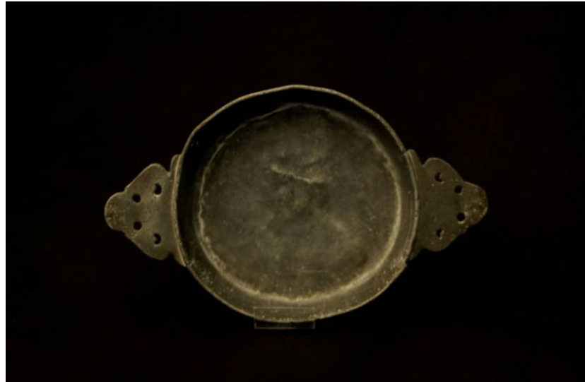
Ecuelle à oreille, 18 ème siècle, Etain, Coll. C.H.L.

L'écuelle, en usage dès le Moyen Âge, a la même fonction que l'assiette creuse actuelle. En bois, en terre cuite ou en métal, elle sert à la consommation des bouillons et des potages. A la fin du 18 ème siècle, elle est progressivement remplacée par l'assiette à soupe ou par le bol.