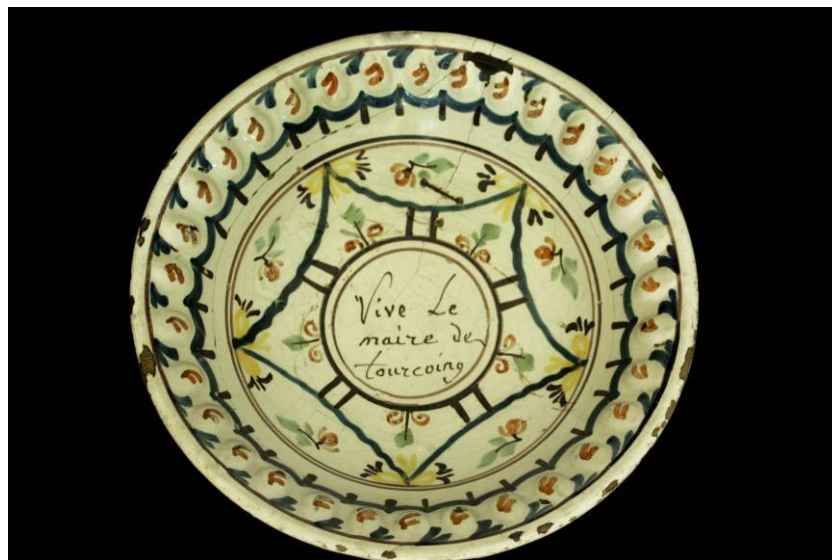
Plat révolutionnaire « Vive le maire de Tourcoing », Fin 18 ème - Début 19 ème siècles, Faïence peinte, Coll. C.H.L.

La vaisselle à décor révolutionnaire, produite entre la fin du 18 ème et le début du 19 ème siècle, se distingue par ses décors rappelant les événements marquants ou les emblèmes de la Révolution. Ces objets, chargés de symbolisme, sont destinés à orner les murs et les vaisseliers. Ils jouent un rôle de commémoration des événements révolutionnaires et d'affirmation des valeurs républicaines. Ici, le plat rend hommage au maire dont la fonction incarne l'idée de la démocratie au niveau local.