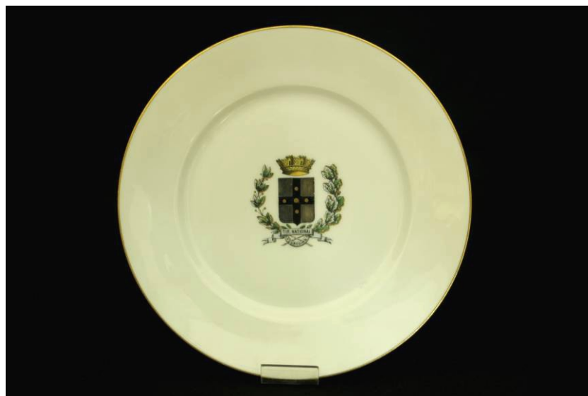
Assiette de la Société du Tir national de Tourcoing, Après 1913, Porcelaine, Coll. C.H.L.

La vaisselle à décor révolutionnaire, produite entre la fin du 18 ème et le début du 19 ème siècle, se distingue par ses décors rappelant les événements marquants ou les emblèmes de la Révolution. Ces objets, chargés de symbolisme, sont destinés à orner les murs et les vaisseliers. Ils jouent un rôle de commémoration des événements révolutionnaires et d'affirmation des valeurs républicaines. Ici, le plat rend hommage au maire dont la fonction incarne l'idée de la démocratie au niveau local.