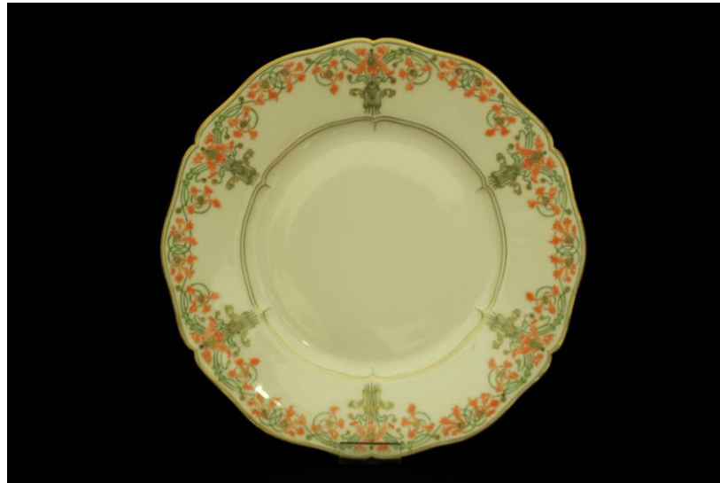
Assiette, Entre 1890-1900, Porcelaine lithographiée et peinte, Manufacture nationale royale de Sèvres, Coll. C.H.L.

La porcelaine de la manufacture de Sèvres, ancienne manufacture royale, se retrouve sur les plus belles tables bourgeoises et aristocratiques d'Europe. Le décor de ces assiettes privilégie les lignes végétales stylisées, au tracé courbe et sinueux, qui reflètent l'influence de l'Art nouveau sur les arts décoratifs à la fin du 19 ème siècle.