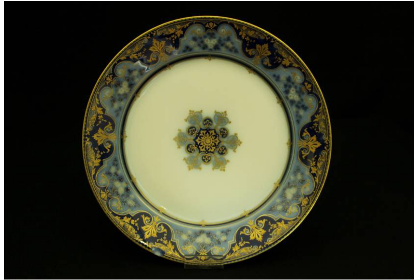
Assiette, Entre 1890-1900, Porcelaine lithographiée et peinte, Manufacture nationale de Sèvres

La porcelaine de la manufacture de Sèvres, ancienne manufacture royale, se retrouve sur les plus belles tables bourgeoises et aristocratiques d'Europe. Le décor de ces assiettes privilégie les lignes végétales stylisées, au tracé courbe et sinueux, qui reflètent l'influence de l'Art nouveau sur les arts décoratifs à la fin du 19 ème siècle.