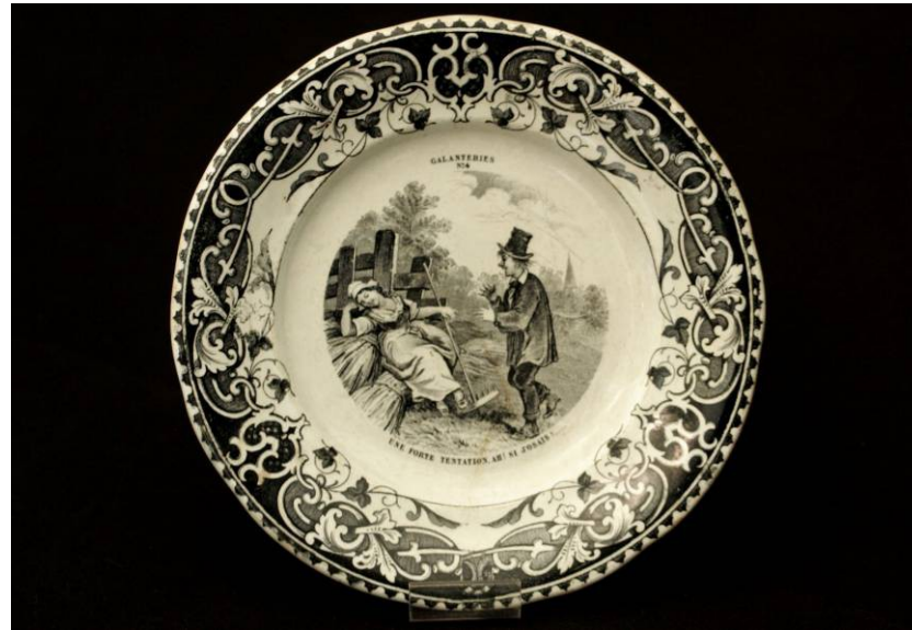
Assiette à dessert, 1876-1884, Faïence lithographiée, Manufacture de Creil et Montereau

Le 19 ème siècle est l'âge d'or des assiettes illustrées. Les décors, imprimés de façon industrielle, rendent ce produit accessible à tous. Ce sont des scènes historiques, politiques, moralisatrices et humoristiques qui servent de sujet de discussion et de divertissement à table. Ici, la scène intitulée « Une forte tentation. Ah ! Si j'osais ! » tourne en dérision l'homme du peuple aux mauvaises manières.