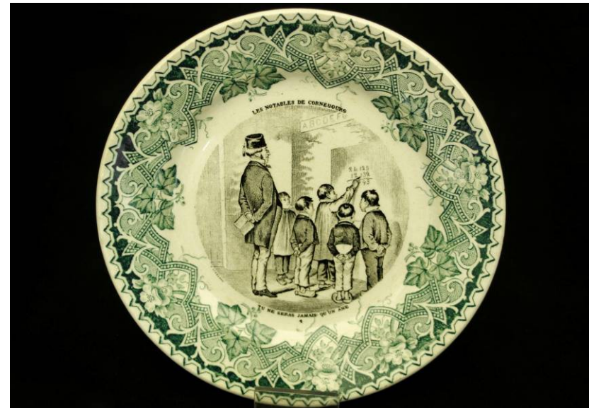
Assiette à dessert, 4 ème quart du 19 ème siècle, Porcelaine émaillée et lithographiée, Manufacture de Lunéville, Coll. C.H.L.

Le 19 ème siècle est l'âge d'or des assiettes illustrées. Les décors, imprimés de façon industrielle, rendent ce produit accessible à tous. Ce sont des scènes historiques, politiques, moralisatrices et humoristiques qui servent de sujet de discussion et de divertissement à table. Ici, la scène intitulée « Une forte tentation. Ah ! Si j'osais ! » tourne en dérision l'homme du peuple aux mauvaises manières.