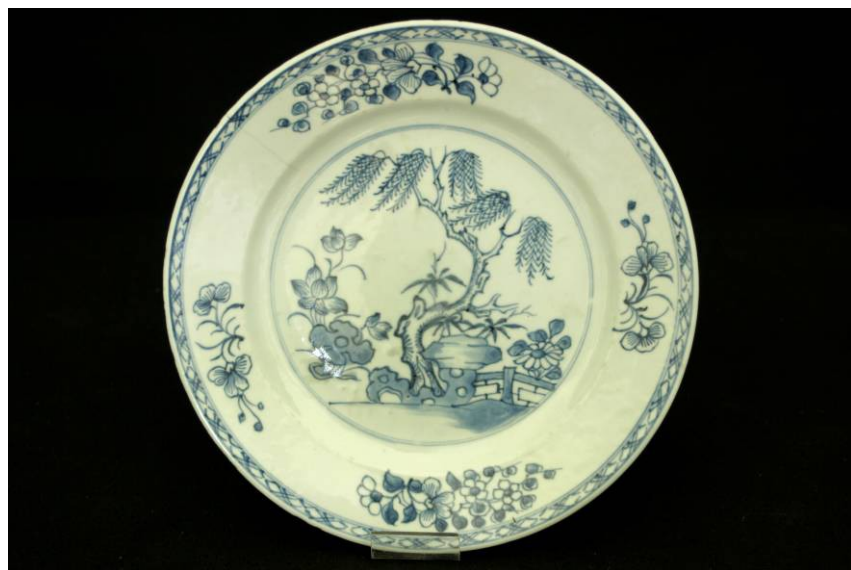
Assiette au motif du saule, 18 ème ou 19 ème siècle, Faïence émaillée, Manufacture de Delft (provenance présumée), Coll. C.H.L.

Ces assiettes au décor de chinoiseries bleues sont caractéristiques de l'influence de l'Extrême-Orient sur la céramique européenne. A partir du 17 ème siècle, elles se répandent en Europe, grâce à la manufacture de Delft en Hollande dont les modèles sont copiés ensuite par les manufactures françaises. Les décors de motifs stylisés de pagodes et de personnages illustrent un imaginaire collectif empreint d'exotisme, en vogue jusqu'à la fin du 19 ème siècle.