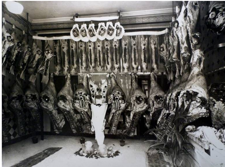
Intérieur de boucherie, Milieu 20 ème siècle, Photographie, Henri Coutart, Coll. C.H.L.

Mais la conservation des aliments s'avère non conforme aux nouvelles règles sanitaires, si bien que les halles sont transformée en salle de spectacle, puis démolies en 1935.