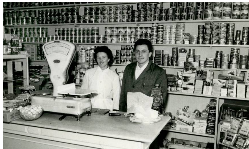
Épicerie, Milieu du 20 ème siècle, Photographie

Cette publicité met en avant la relation de confiance supposée entre le consommateur et le commerçant de proximité.