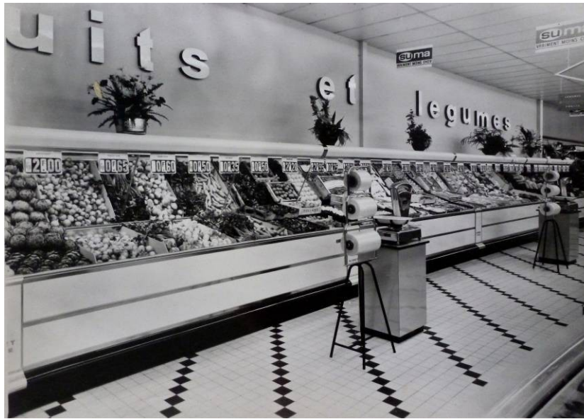
Étal de supermarché, Milieu du 20 ème siècle, Photographie

Après la Seconde Guerre Mondiale, les hyper et supermarchés deviennent les symboles de la consommation de masse pour les classes populaires. L'abondance des étals est perçue comme une revanche sur les temps de pénurie tandis que le principe du libre-service donne l'illusion d'une plus grande liberté de choix et d'une maîtrise des prix.