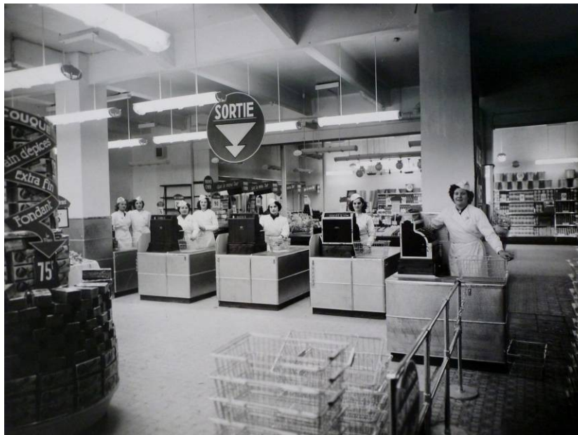
Caisses d'un supermarché, Milieu du 20 ème siècle, Photographie, Henri Coutard, Coll. C.H.L.

Le personnel des grandes surfaces est concentré à des points stratégiques : caisses et réserves pour gérer les stocks et le réapprovisionnement des rayons. L'accompagnement du consommateur dans son achat est désormais déshumanisé. Panneaux d'orientation, publicités et l'affichage de prix prennent le relais.