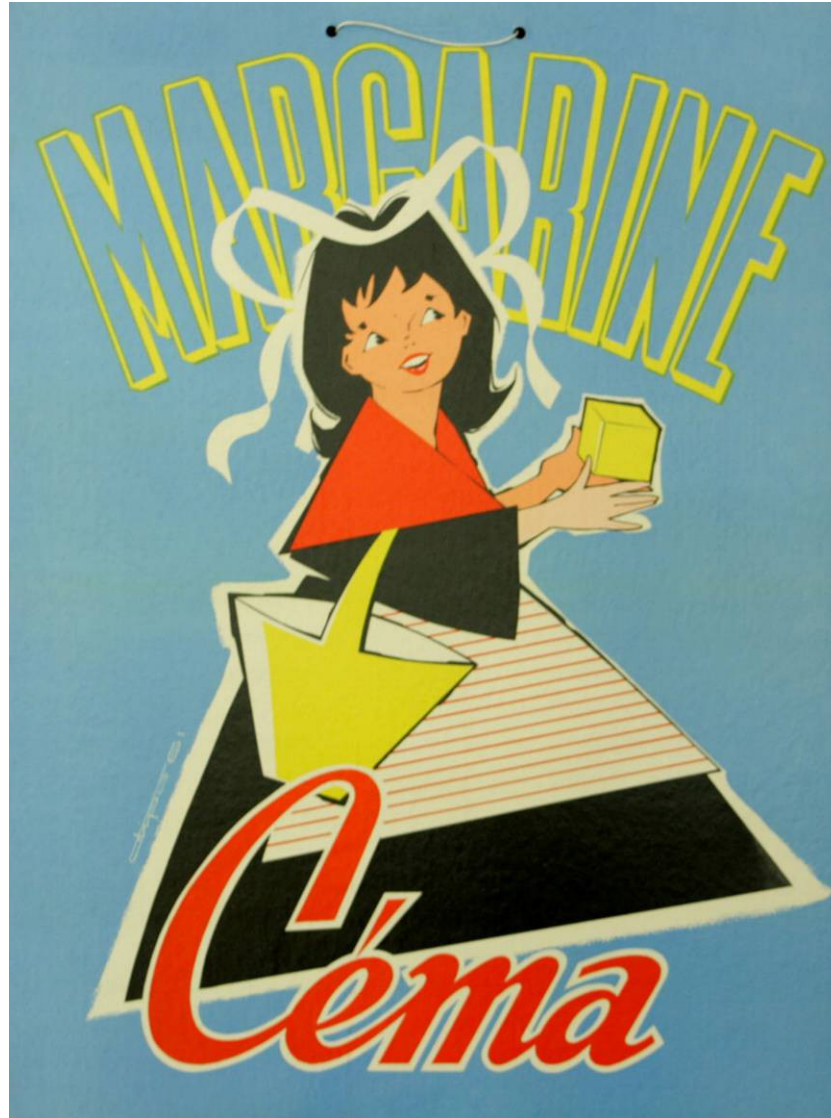
Pancarte publicitaire pour la margarine « Céma », Milieu du 20 ème siècle, Impression sur carton, Coll. C.H.L.

La margarine, inventée en 1869, est un produit issu de la collaboration entre la recherche pharmaceutique et l'industrie agro-alimentaire. Il s'agissait de créer une alternative au beurre moins coûteuse pour les classes populaires. L'usine Céma, installée à Bondues en 1895, est l'une des premières firmes à fabriquer la margarine. Récemment, la firme a mis au point la margarine Primevère avec la collaboration de l'Institut Pasteur de Lille.