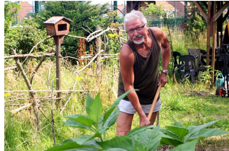
Habitant jardinier des jardins de la Marlière à Tourcoing, Août 2013, Photographie

Le développement de l'agriculture en ville est un sujet d'actualité qui suscite de nombreuses idées et démarches. Le projet « Les Bains », lauréats du concours Lille/Design for Change propose ainsi de reconvertir l'ancienne piscine de Tourcoing selon une idée originale : « Il s'agit de mettre en symbiose des poissons qui séjourneraient dans les bassins de la piscine, dont l'eau serait épurée par des plantes maraîchères cultivées en surface, alimentées par ce dispositif. L'ensemble serait un lieu d'échange convivial, accessible au public directement concerné par la cueillette. »