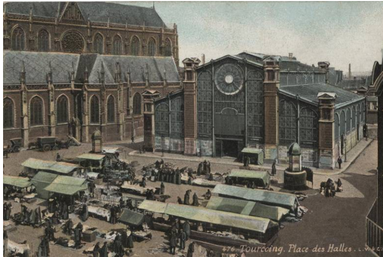
Les Halles de Tourcoing, 1ère moitié du 20 ème siècle, Carte postale colorisée

Les halles sont achevées à Tourcoing en 1880 et accueille 18 emplacements de boucherie. En centralisant les étals, la municipalité souhaite ainsi encadrer et réglementer davantage les pratiques des marchands. Le bâtiment, très moderne, répond aux principes de construction déjà utilisés à Paris par Victor Baltard : la brique est ici mariée à une armature métallique qui soutient une immense verrière.