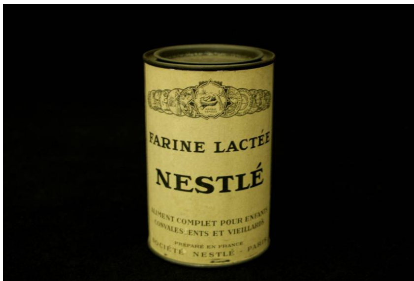
Boîte de farine lactée de la marque Nestlé, Fin 19 ème siècle, Tôle et papier imprimé

Justus Liebig, chimiste et fondateur de la marque du même nom, perfectionne le procédé de dessiccation de la viande déjà utilisé par les Américains inventeurs du « meat biscuit ». L'extrait de viande est destiné à compléter le régime alimentaire pauvre en lipides des populations ouvrières européennes. Les cubes de bouillon de la marque Liebig sont mis en vente à partir des années 1865.