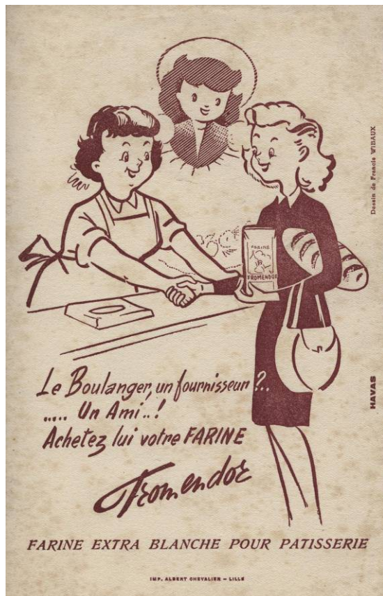
Buvard pour la farine « Fromendor », Milieu du 20 ème siècle, Impression sur papier, Coll. C.H.L.

Cette publicité met en avant la relation de confiance supposée entre le consommateur et le commerçant de proximité.