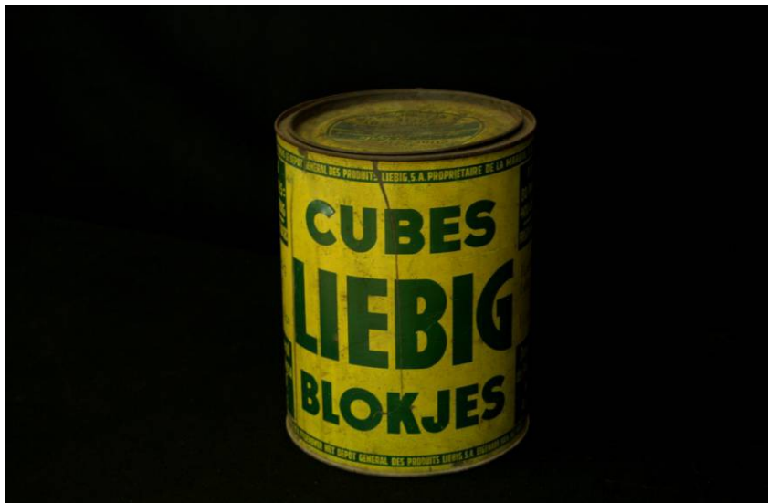
Boîte de cubes de bouillon de la marque Liebig, Tôle et papier imprimé, Coll. C.H.L.

Justus Liebig, chimiste et fondateur de la marque du même nom, perfectionne le procédé de dessiccation de la viande déjà utilisé par les Américains inventeurs du « meat biscuit ». L'extrait de viande est destiné à compléter le régime alimentaire pauvre en lipides des populations ouvrières européennes. Les cubes de bouillon de la marque Liebig sont mis en vente à partir des années 1865.