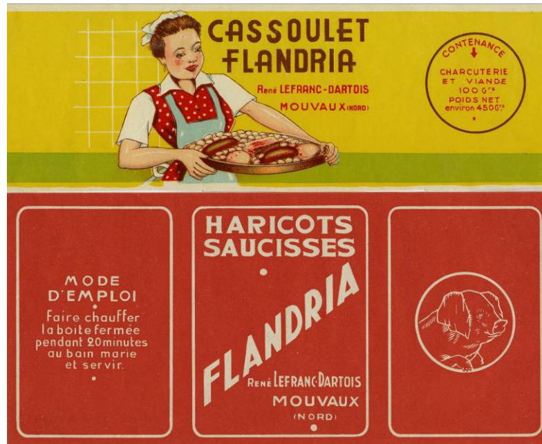
Étiquette de conserve de la marque Flandria, Années 1920, Impression sur papier, Coll. C.H.L.

Les premières conserves sont mises sur le marché au début du 19 ème siècle mais restent des produits onéreux et suscitent la méfiance. En 1890, une boîte de petits pois vaut encore 1,50 franc soit 15 heures de travail d'une ouvrière. Il faut attendre les années 1950 pour que la consommation de produits transformés se démocratise. Biscottes, biscuits, pâtisseries industrielles, confitures et conserves entrent alors dans la consommation quotidienne des ménages. De nouveaux modes de conditionnement, comme le café moulu, et de nouvelles techniques de conservation, comme le surgelé et le sous vide, simplifient la fabrication du repas et permettent de gagner du temps. Ils sont adaptés à de nouveaux modes de consommation.